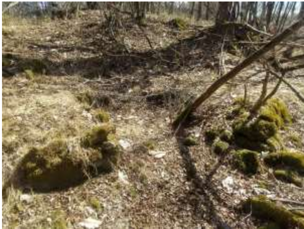
(530) 目立つ人工特徴物：炭焼き窯跡の例