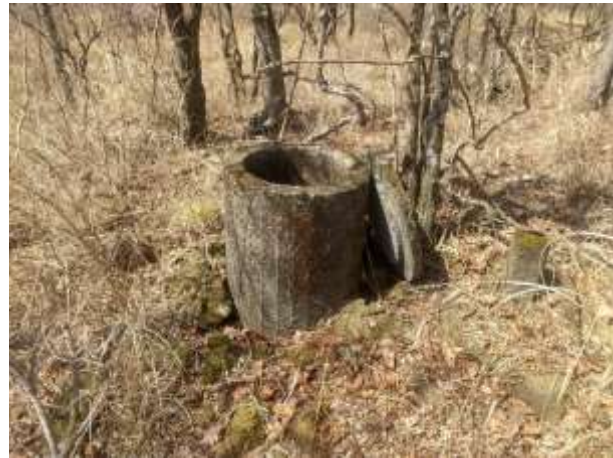
(531) 目立つ人工特徴物 (×)：土管の例