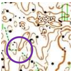
例1:凹地の南のふち

凹地と沢のコントロール位置説明について： 等高線1本で描かれる凹地に設置されたコントロールはすべて凹地の位置説明で記載しています（下図、例1）。等高線2本以上で描かれる凹地の斜面に形成された沢状の地形に設置してあるコントロールは沢の位置説明で記載しています（下図、例2）。